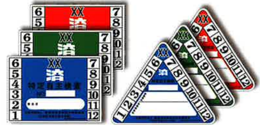
特定自主検査済標章 (事業内)

労働安全衛生規則に基づき、「建機付属クレーン部分」、「ショベルローダー、フォークローダー及びストラドルキャリアー」について、年1回実施することとされている定期自主検査（年次検査）を行った年月を明らかにするため当該機械に貼る標章です。